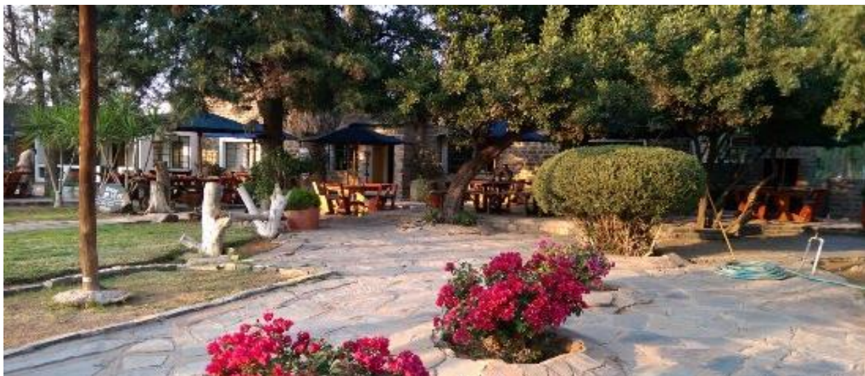
Installation dans vos chambres, dîner et logement

Situé dans le sud de la Namibie, l'hôtel offre 22 chambres, beau jardin luxuriant avec des oiseaux sauvages. Il a été créé pendant la période coloniale allemande comme une ferme. Plus tard, il est devenu célèbre pour son élevage de moutons Karakul et actuellement des bovins et des chèvres y sont élevés. L'hôtel fait partie de la ferme historique de 11 000 hectares de Helmeringhausen et constitue une étape idéale sur la route entre Lüderitz et le parc Namib-Naukluft. L'Hotel possède un restaurant chaleureux et confortable avec des repas exquis et une piscine rafraîchissante. Il y a aussi un salon confortable avec des canapés et une cheminée accueillante.