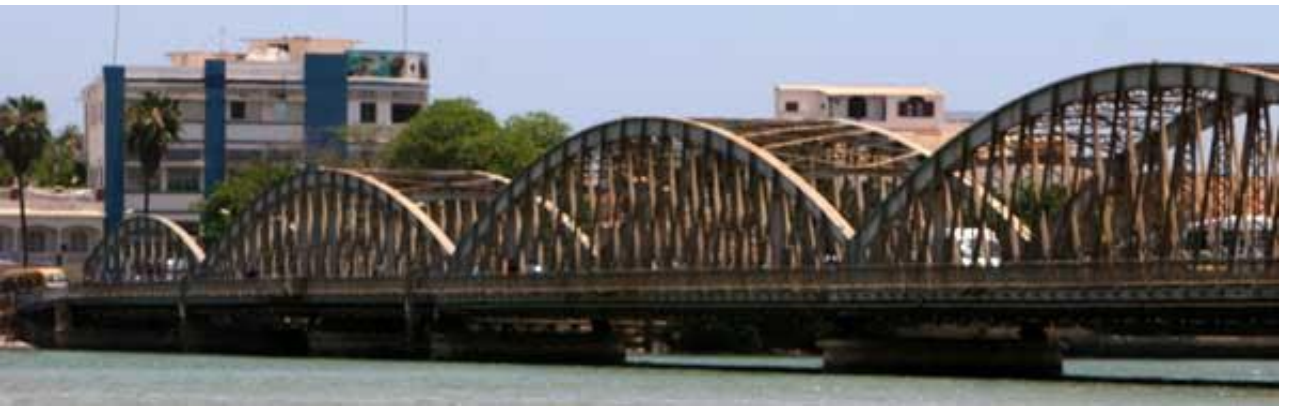
Arrivée à Saint Louis à l' hôtel Mermoz ou similaire www.hotelmermoz.com